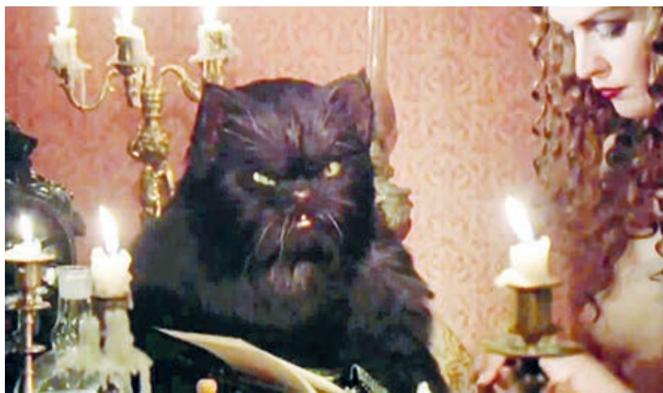
ФОТО ИЗ ОТЧЕРКОВ ИСТОЧНИКОВ

Стоит сказать, что кот-экзорцист пользуется большой популярностью: объявле-