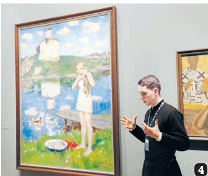
1 Эта выставка должна была бы работать как минимум полгода, но ее «упустили» всего в три недели.